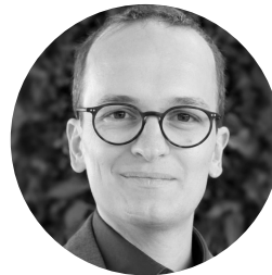
Martin Neukom, Regierungsrat und Bau- direktor des Kantons Zürich

Mit einer Ad-hoc Intervention der schweizerisch-italienischen Autorin Zora del Buono , Autorin des Bestsellers „Das Leben der Mächtigen. Reisen zu alten Bäumen“